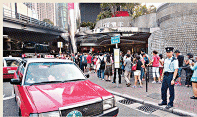
■山頂纜車站假日常有遊客大排長龍。